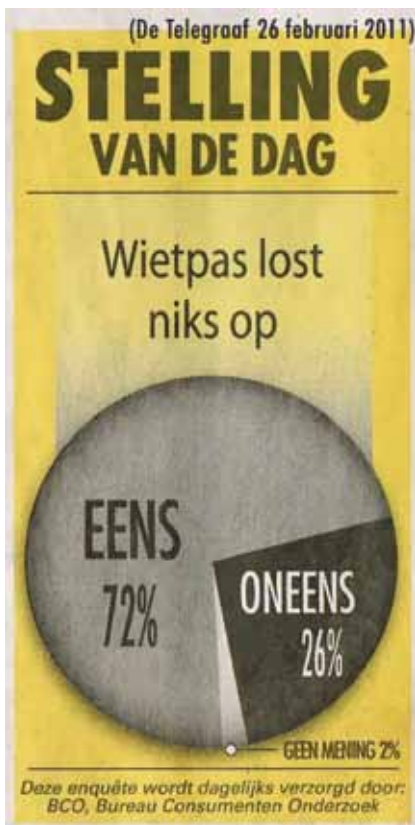
De Telegraaf, 26 februari 2011

ANGST Klachten Pottenberg en Heugemerveld