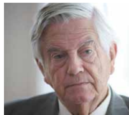
Frits Bolkestein (VVD):

Overtuigd voorstander van regulering/legalisering van cannabis