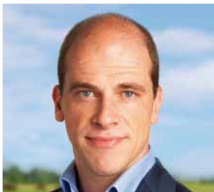
Diederik Samsom (PvdA):

'Die wietpas moet zo snel mogelijk weg. Alle waarschuwingen om het niet te doen zijn in de wind geslagen, en je ziet wat er van komt. Meer en meer straathandel, want daar zit geld in. Die pas is helemaal niets.'