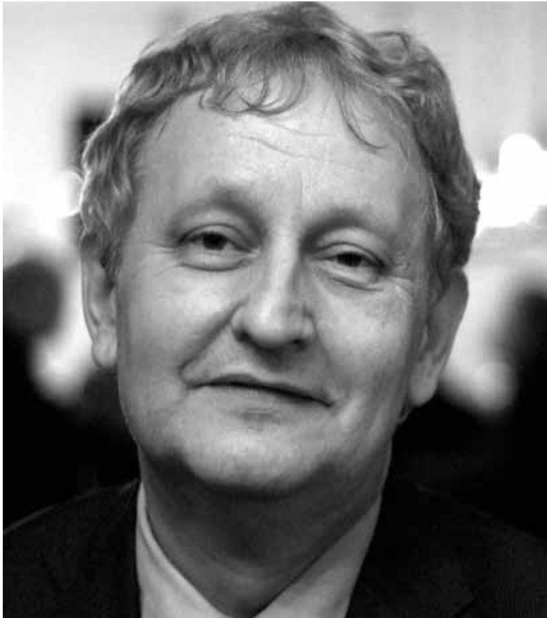
Eberhard van der Laan (PvdA), burgemeester Amsterdam