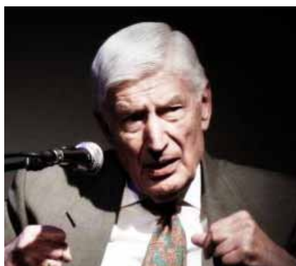
Dries van Agt (CDA):

'Als Kamerleden hun hart en hun verstand zouden volgen, was er morgen een meerderheid voor cannabisregulering.'