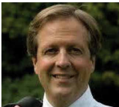
Alexander Pechtold (D66):

'Die wietpas moet zo snel mogelijk weg. Alle waarschuwingen om het niet te doen zijn in de wind geslagen, en je ziet wat er van komt. Meer en meer straathandel, want daar zit geld in. Die pas is helemaal niets.'