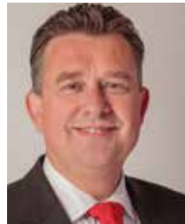
Emile Roemer (SP)