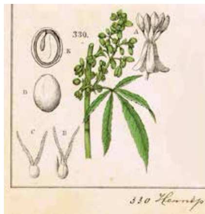
'Hennip', oftewel cannabis in Oudemans: De Flora van Nederland (1859)