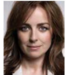
Marianne Thieme (PvdD)