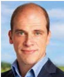
Diederik Samsom (PvdA)