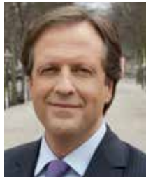
Alexander Pechtold (D66)